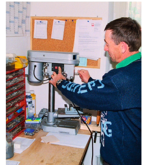
Maßnahmennummern der Arbeitsgelegenheiten: 720-25 und 721-25

im Beratungs- und Familienzentrum Caritashaus